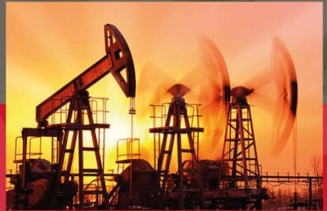
Oil & Gas